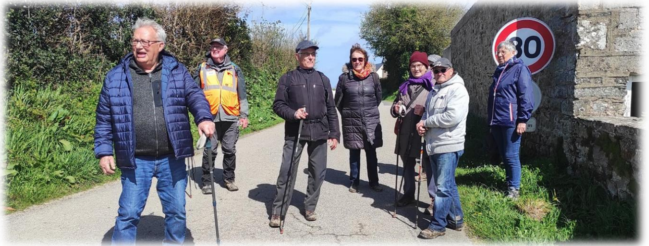
La séparation, groupe raccourci.