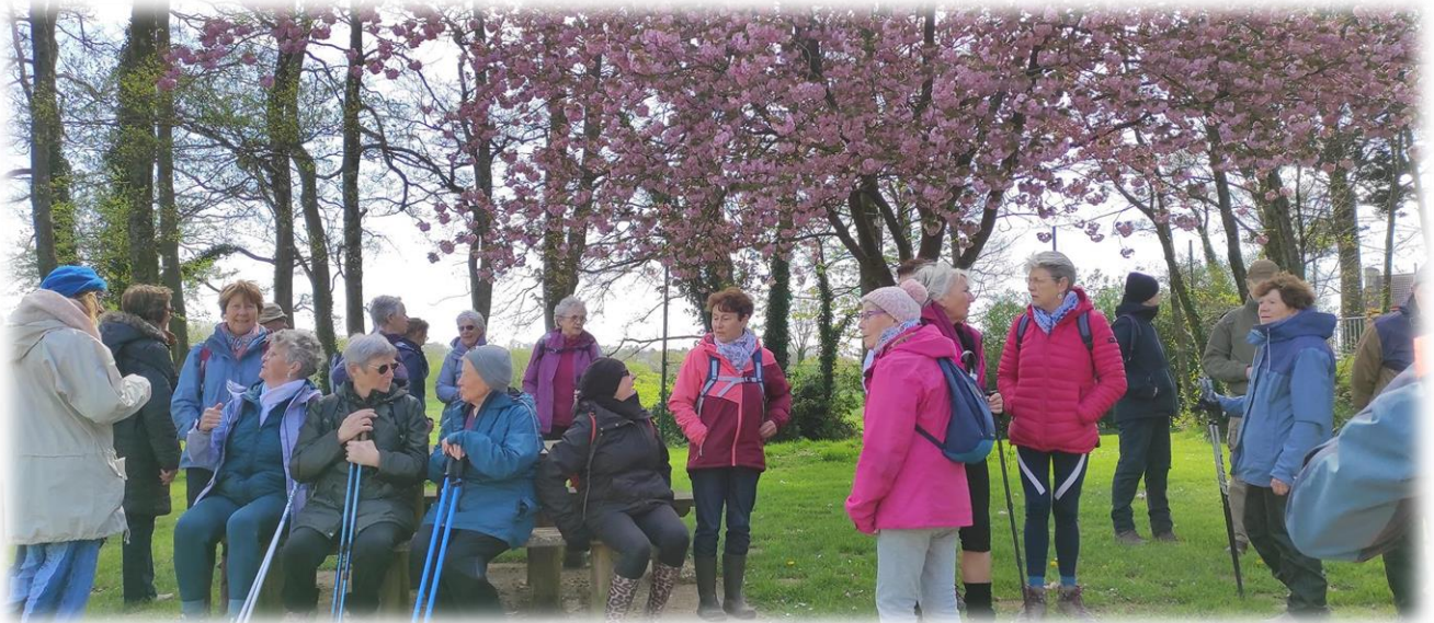
Lieu-dit « la commune » à Sideville, on se prépare pour la photo de groupe