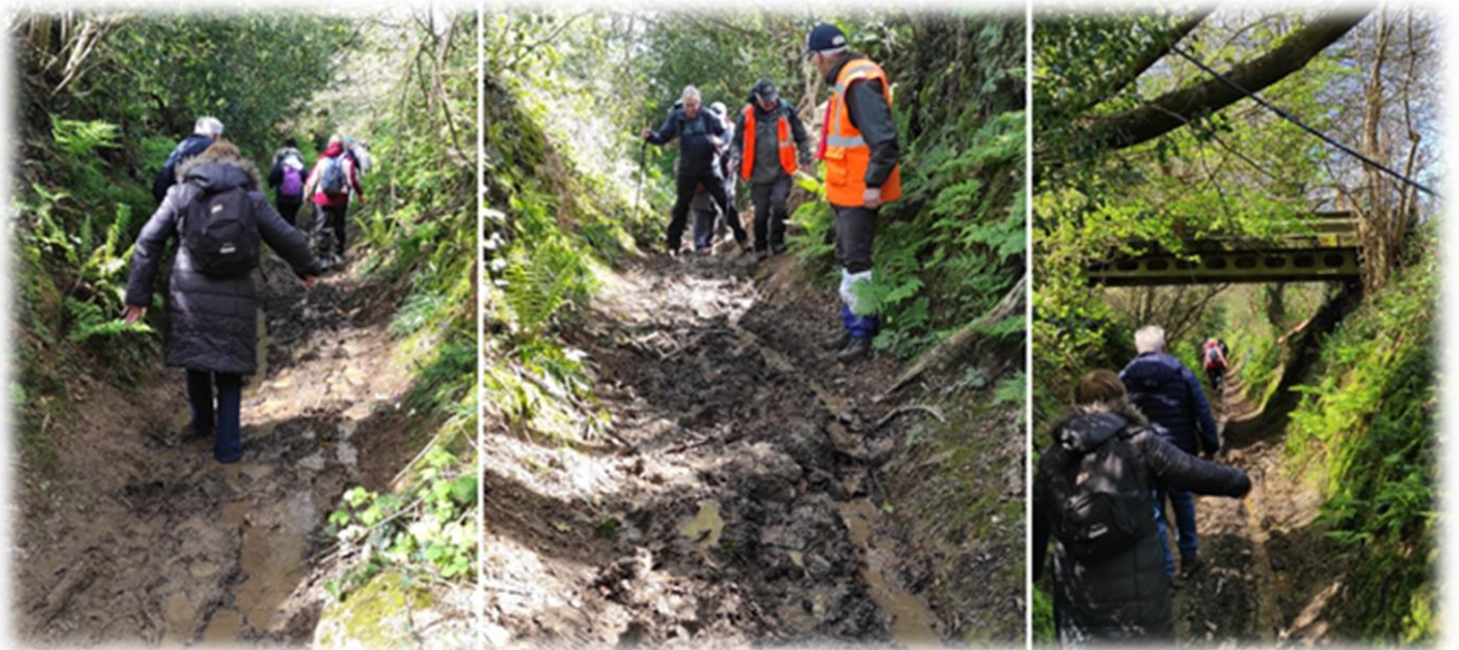
Descente vers Sideville, sentier glissant,