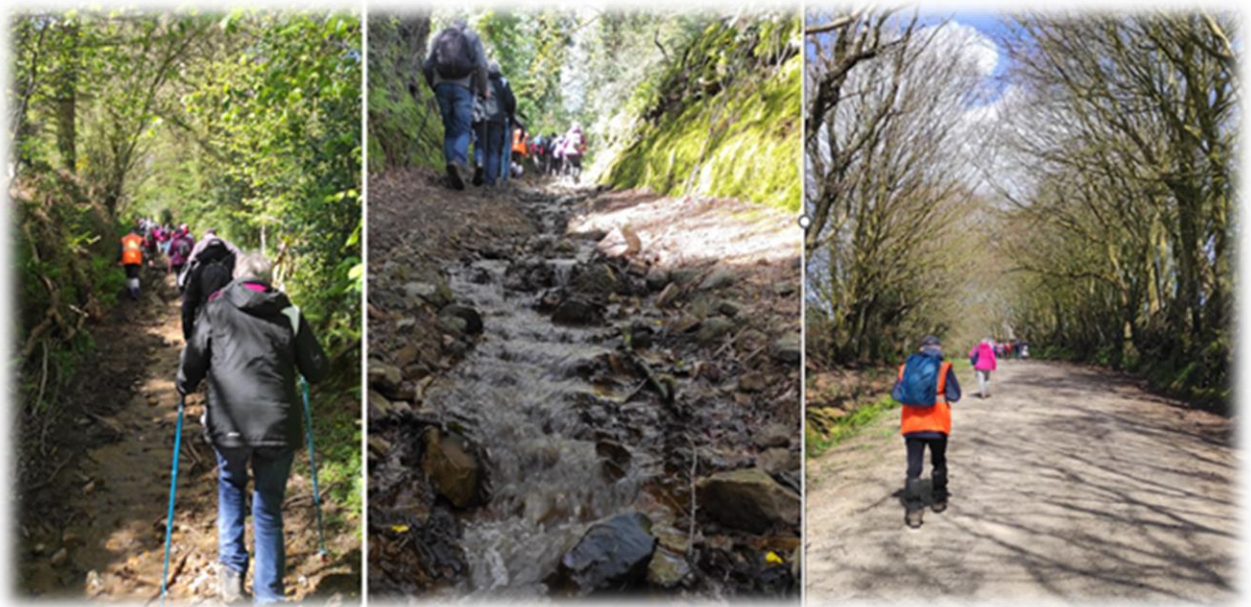
Chemins longeant le Bois du Mont du Roc