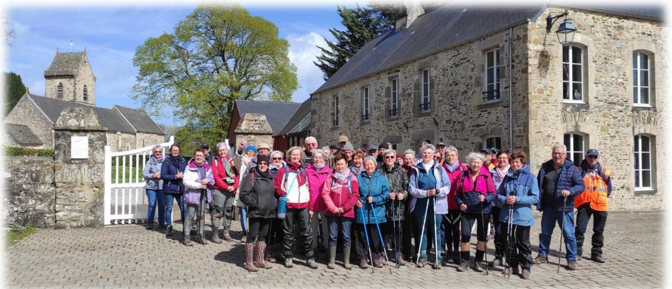
Photo de groupe devant l'église Saint-Ouen bâtie au XVI e et l'ancien presbytère avec sa cheminée octogonale, devenu la mairie. On dit que Sideville, dans son écrin de verdure, est « le plus joli petit coin de la Divette »