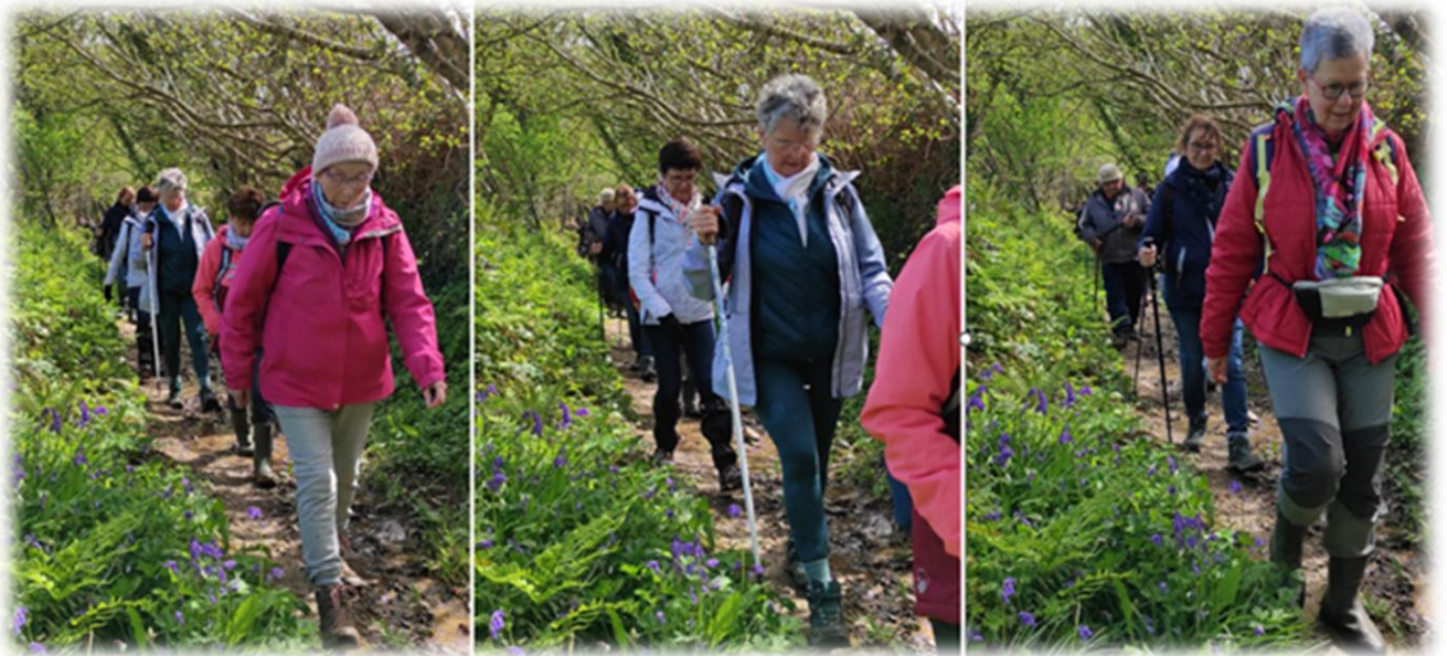
Un sentier fleuri et ombragé