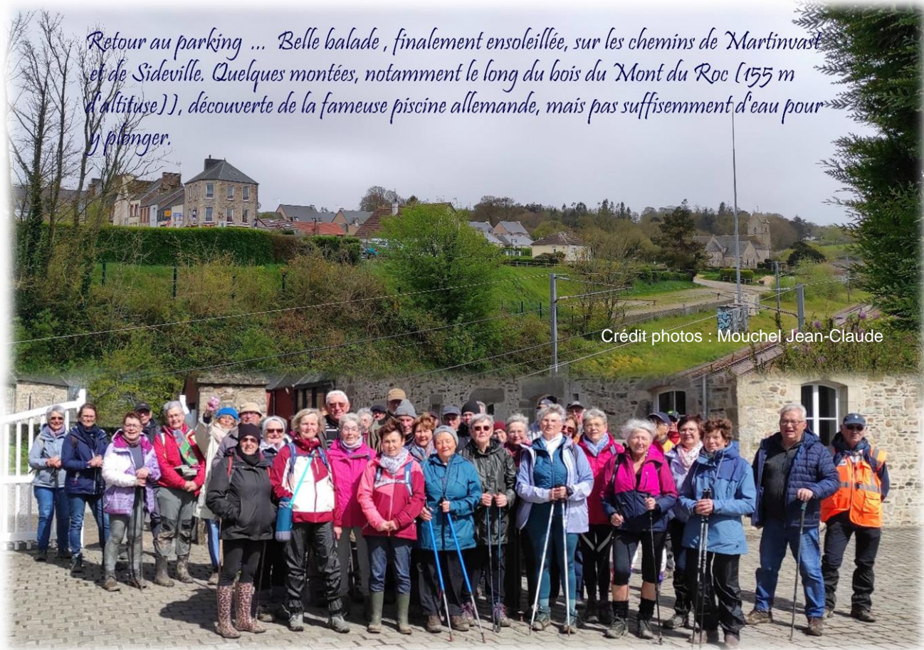
Peu de participants, 46, sûrement à cause de la météo peu encourageante en matinée jusqu'au départ.