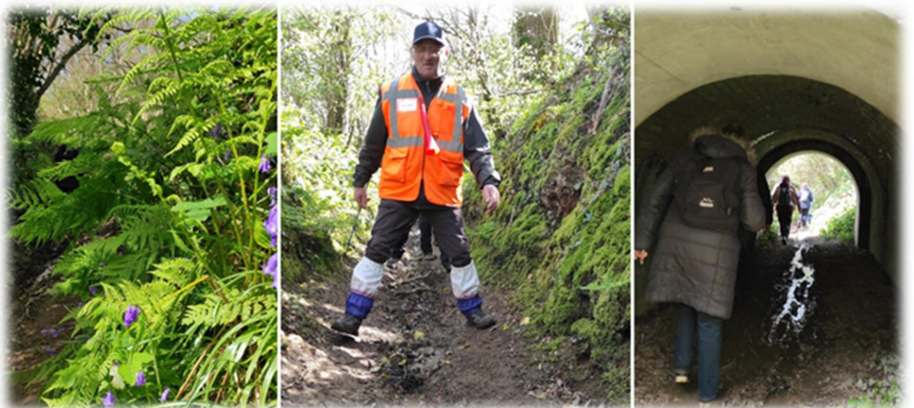
avec passage sous la route